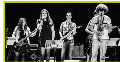
Groupes de Musiques Actuelles