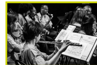
L'orchestre d'Harmonie « Effet Mer »

Atelier de percussions (pour ados et adultes)