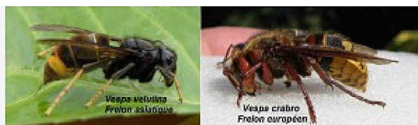
frelon asiatique différent du frelon crabro

Ici les photos montrent des femelles fondatrices photographiées au printemps. On dit que la nuit, tous les chats sont gris, cependant pour les frelons en plein soleil les différences de couleurs sont caractéristiques, ainsi que la grosseur s'ils sont disposés côte à côte !